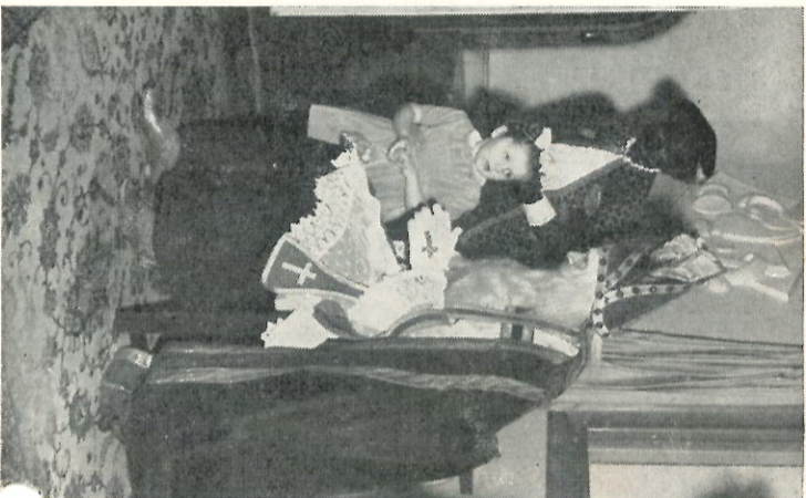
Hierna verliet de Sint de zaal en ging op de gang zitten om alle kinderen bij het weggaan nog een pakje te geven.

Zichtbaar onder de indruk dankte de heer Hey voor het gesproken, de cadeaus en de grote belangstelling waarvoor hij de hem toegezwaarde lof graag deelde met zijn vrouw en kinderen en zijn medewerkers.